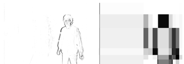
FIG. 3 – Détection de mouvement dans un flux vidéo : à gauche, image résultant de la différence entre deux trames successives ; à droite, segmentation en grille de cette image avec visualisation des zones de forte entropie

On propose ici d'évaluer l'utilisation potentielle des modèles d'image en grille pour la détection de mouvement. Dans un flux vidéo, on effectue la différence entre deux trames successives afin de détecter les mouvements en se basant sur les régions ayant changé de couleur. La figure 3 présente un tel exemple dans le cadre d'un flux vidéo en niveaux de gris.