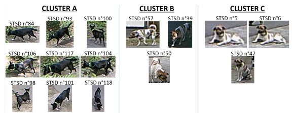
FIGURE 2 : Résultats du clustering agglomératif en utilisant la distance de Hausdorff. Trois clusters sur les 72 sont montrés.

Pour une utilisation pratique, des informations supplémentaires telles que la position GPS des caméras ou l'heure d'acquisition pourraient être utilisées afin d'augmenter la précision des résultats et une vérification visuelle pourrait être nécessaire.